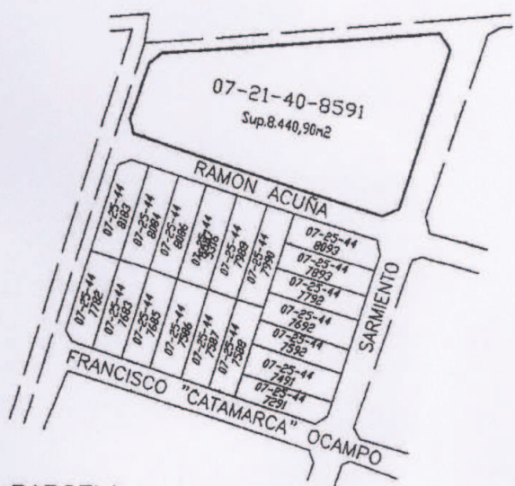
DETALLE PARCELA 07-21-40-8591