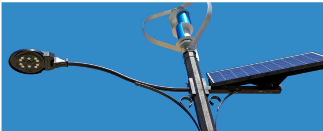
Farola Híbrida Autosuficiente (modelo Ordenanza N° 7228/18)