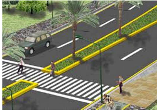
Bulevar (imagen 1)