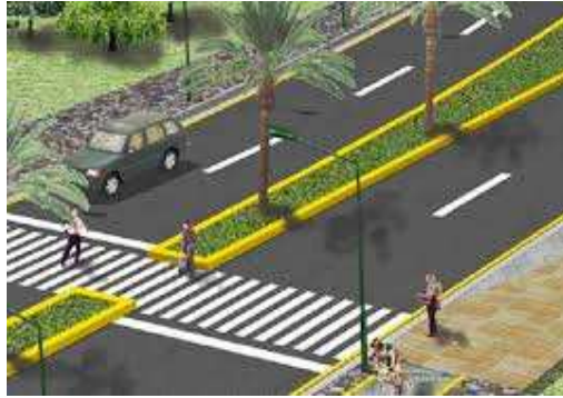
Bulevar, imagen 1