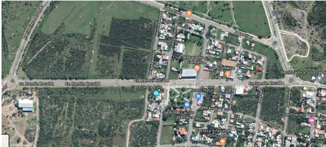
Avenida Ramón Recalde, imagen 3