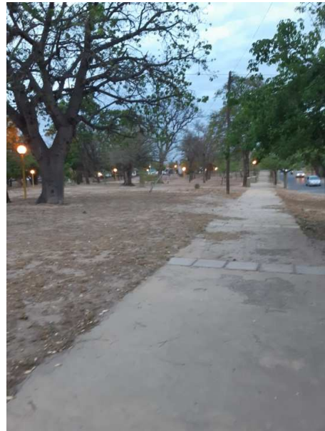
ANEXO I: LATERALES DE LA PLAZA