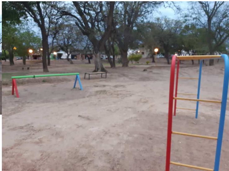
ANEXO V: JUEGOS INFANTILES