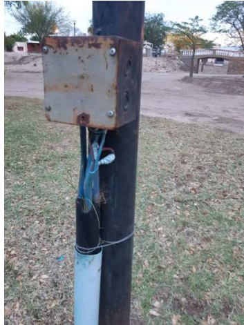
ANEXO IV: INSTALACION ELECTRICA