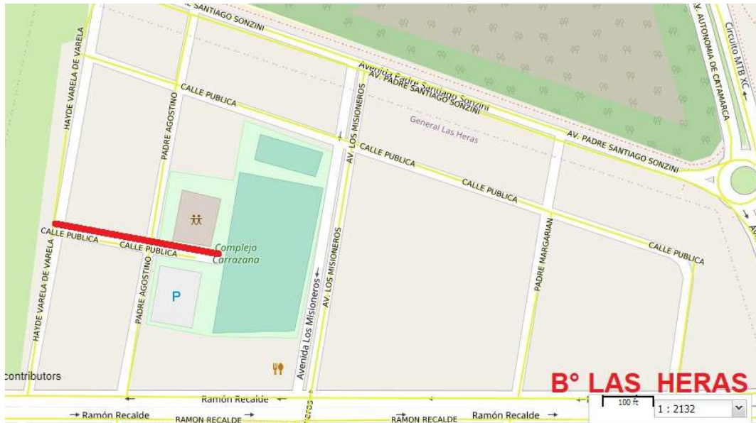
ANEXO 1: Tramo de arteria paralela a Av. Recalde entre Av. Misiones y Calle Hayde Varela de Varela.