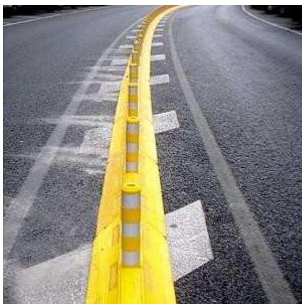
DELIMITADOR, DEMARCATORIO Y DELINEADOR REFLECTIVOS.-