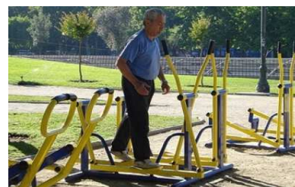
Rotonda principal de la quebrada, lugar donde se pretende la implementación de un gimnasio biosaludable y acondicionamiento de esta.