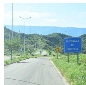
Quebrada de Moreira, Espacio elegido por muchos para la ejercitación diaria.