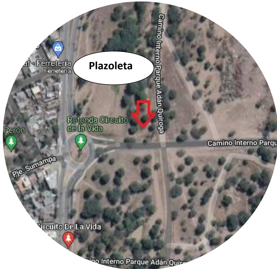
Anexo I: ↓ Referencia plaza circuito de la vida